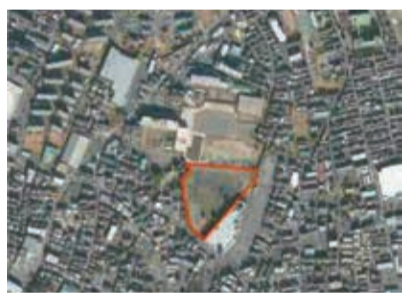
県立衛生研究所跡地(敷地面積:13,326㎡)

スポーツシュレ推進施設では、子供から高齢者まで、市民の様々な年齢層、個々の体力に応じて、スポーツの楽しさを伝える指導者人材の育成や、スポーツにおける最先端の知見やデータを蓄積し、市民やアスリートにフィードバックしていく機能などを導入検討中で、本市のスポーツ行政の中心施設として構築されます。あわせて、地域の為の防災機能や市民利用(子供たちの遊び場、グラウンドゴルフ等)についても当然、重要な検討事項であり、適宜丁寧に意見交換を行いながら進められます。