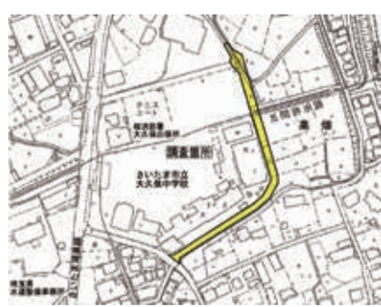
大久保中外周道路▶

大久保中学校東側への外周道路整備が進められています。令和5年度は用地測量が行われ、令和6年度は路線測量及び詳細設計が進められます。